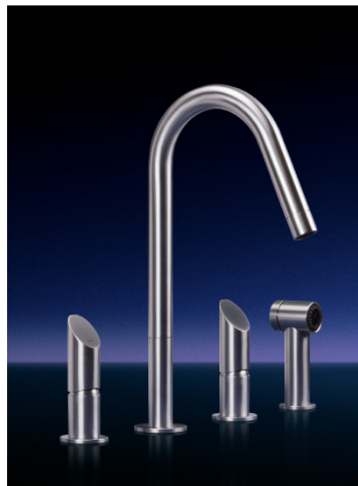
Dreiloch-Armatur T 45 mit separater Handbrause