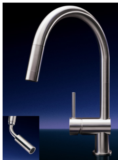
...mit ausziehbarer Handbrause