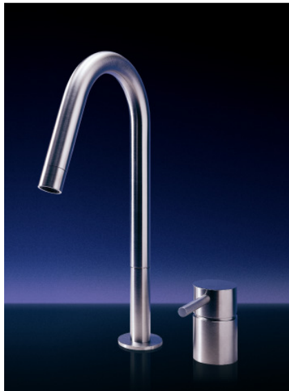
F 2 SQ mit separater Handbrause Zweiloch-Armatur F 2