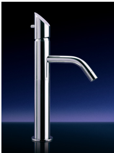
Einhandmischer T 45 glänzend