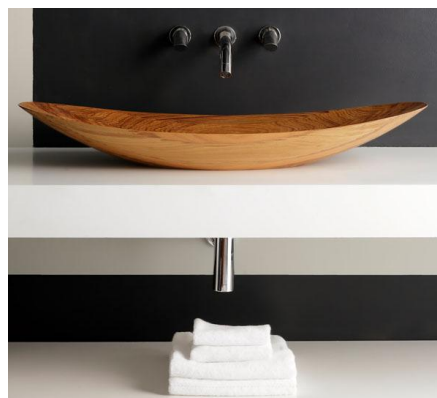
Elegantes Aufsatz- Waschbecken SARY oval

Badewanne PAGAN mit vertieftem Einsteig kombiniert mit ovalem Aufsatz-Waschbecken SULE, farblich harmonisch abgestimmt mit Umfeldgestaltung in schwarz und grau