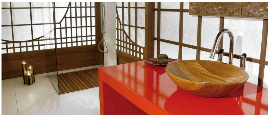
Rundes Aufsatz-Waschbecken SITTWE mit MGS-Volledelstahlarmatur sowie bodengleicher Duschwanne Lineare in Teak, erhältlich auch in Gitteroptik